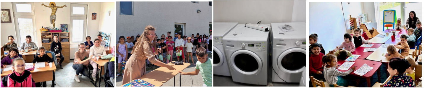
Nachhilfeunterricht, Preise für Nachhilfeschüler Sommer 2025 im Hof, Waschküche für arme Familien, Kindergarten des Zentrums Manchmal, wenn wir die Gelegenheit bekommen, machen wir auch Tagesausflüge mit den Kindern.