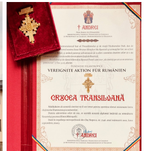
Pfarrer Rednic 2016, Rohbau von der Hofseite 2019, Zentrum 2023, „Crucea Transilvana“ für die VAR 2022