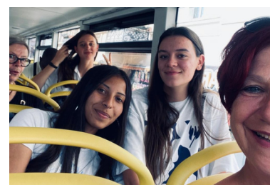
Im Bus und am Brandenburger Tor